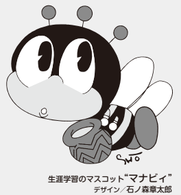
生涯学習の Mascot「マナビイ」 デザイン:石ノ森章太郎