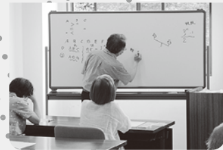
数学パズルを楽しむ