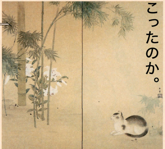
菱田春草「竹に猫」明治33年（1900）