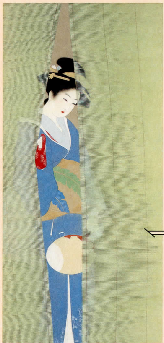
上村松園「夕べ」(部分)昭和10年（1935）頃

美人画とは、美人を写した絵ではなく、女性の美しさを表現した絵のこと。松園は、同じ女性の視点から見た、新しい時代の女性の美しさを格調高く描きあげました。めざましいのは、「一点の卑俗さもなく、清澄な感じのする香り高い珠玉のような絵」。なるほどです。