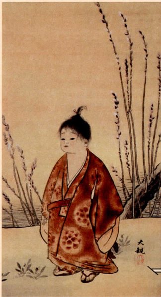
横山大観「無我」明治30年（1897）