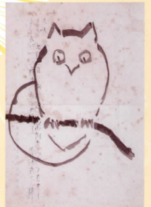
「無題(ミミズクの絵)」*