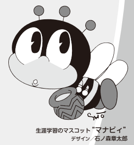
生涯学習のマスコット“マナビイ” デザイン 石ノ森章太郎