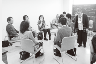
“いい聴き手”になるために