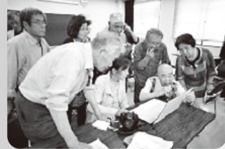
写真で綴る「絶景」 富山の特等席めぐりⅩ