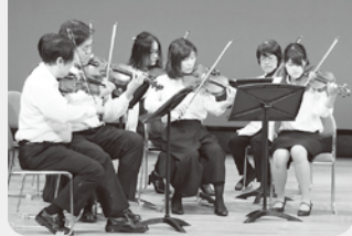
富山弦楽アンサンブル