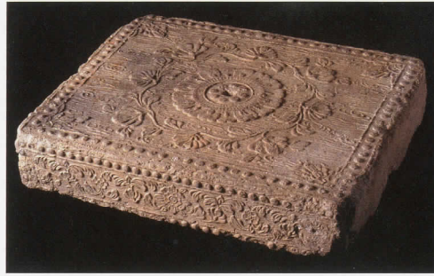
大宰府学校院跡出土 文様磚(長方形) [奈良時代、九州歴史資料館蔵]

電話・FAXにて、イベント名と番号(1)～(5)(番号(5)は希望日時も)、氏名、電話番号を当館までお知らせください。 ※定員に達し次第募集を終了します。 ※FAXの場合、定員に達し、ご参加いただけない場合のみ当館からご連絡いたします。 ※詳しくは当館ホームページをご覧ください。