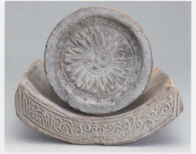
多賀城跡出土 政庁Ⅲ期軒瓦 (細弁蓮華文軒丸瓦/均整唐草文軒平瓦) [奈良時代末期～平安時代、東北歴史博物館蔵]