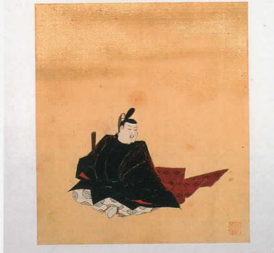
住吉具慶「三十六歌仙図画帖」より「大伴家持」 [江戸時代前期、斎宮歴史博物館蔵]