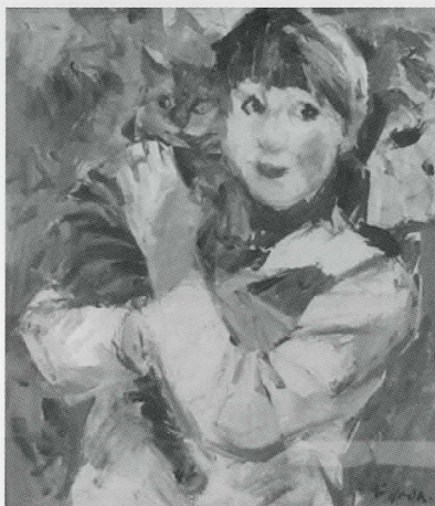
島田 四郎 《おんなネコ》