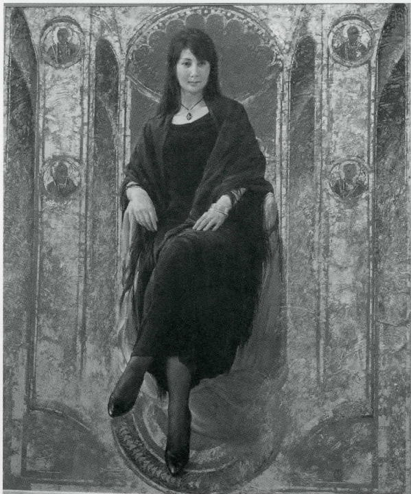
藤森 兼明 《アドレーション サンティ ピエトロ エ パオロ》2012 年