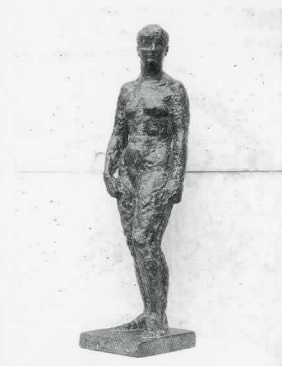
松村外次郎 《パリジェンヌ》1934 年