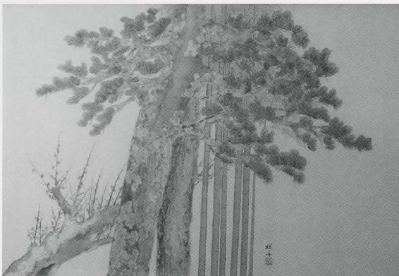
田上 桜舟 《松竹梅》