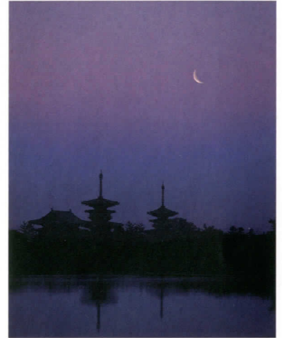
井上博道「西ノ京 勝間田池」