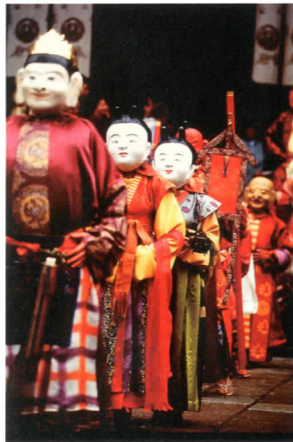
吉岡幸雄制作による伎楽衣装(東大寺蔵)