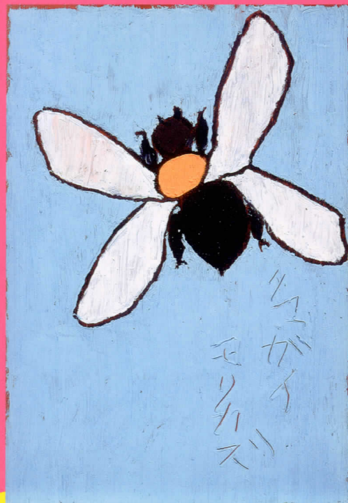
左上：片岡球子《めでたき富士（御殿場にて）》 1991（平成3）年[86歳] 右上：大森運夫《浄瑠璃人形演》（部分） 1995（平成7）年[78歳] 碧南市藤井達吉現代美術館蔵 下左：猪熊弦一郎《City Planning Yellow No.1》 1968（昭和43）年[66歳] 丸亀市猪熊弦一郎現代美術館蔵 ©公益財団法人 ミモカ美術振興財団 下中：富岡鉄斎《瀛州仙境図》1923（大正12）年[88歳] 碧南市藤井達吉現代美術館蔵 下右：熊谷守一《熊蜂》1972（昭和47）年[92歳]