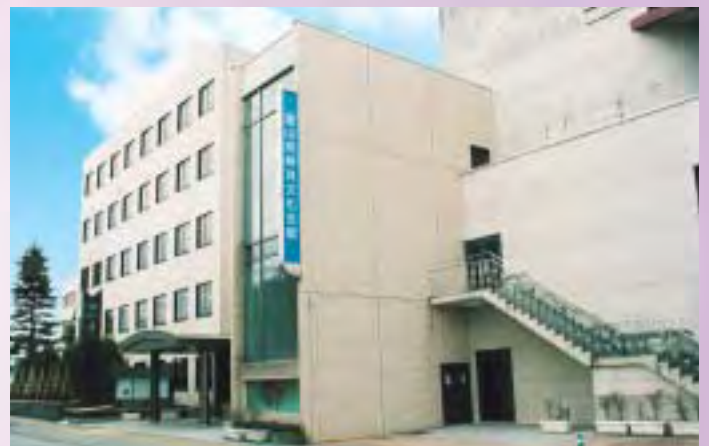
本部・映像センター

富山県生涯学習カレッジ 〒930-0096 富山市舟橋北町7-1 TEL076-441-8401 FAX076-441-6157 E-mail : gayuku-admin@tkc.pref.toyama.jp http://www.tkc.pref.toyama.jp/