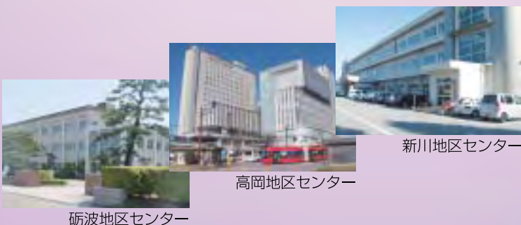
砺波地区センター