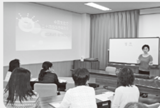
中国三昧一漢方でストレスフリー