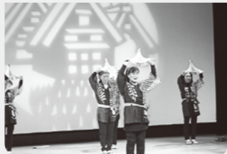
郷土芸能「南京玉すだれ」の修得