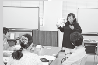
ほっと一息 大人のための絵本deセラピー