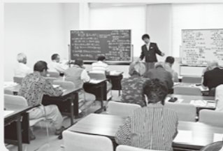
発見!! 越中国の埋もれた歴史